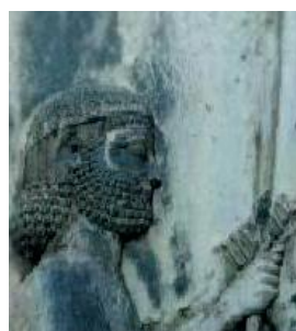
(و) روش پیشنهادی در این مقاله